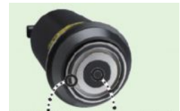
prsten elektroda primarna elektroda

Test zapremske otpornosti uređaja koji se testira koji se nalazi između primarne i suprotne elektrode