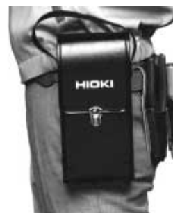
9351 FUTROLA ZA NOŠENJE (standardni dodatak)

Futrola za nošenje za montiranje na kaiš štiti Model 3127-10 od uobičajenih udara i potresa tokom svakodnevnog rada.