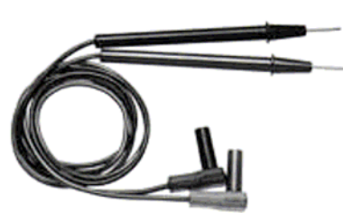
9067 TEST PIPALICE (standardni dodatak)